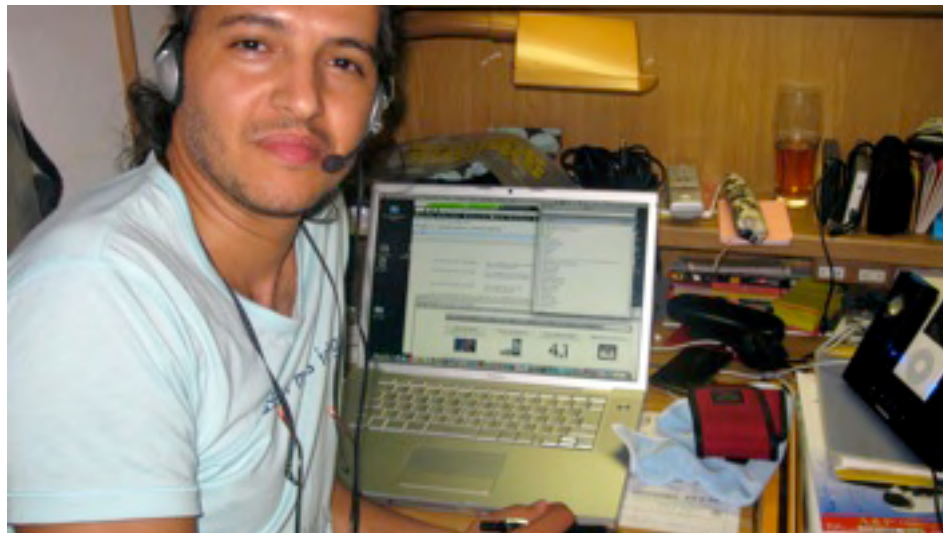
Lors des communications téléphoniques. C'est 23h00 au Japon !

J'ai participé, entant que facilitateur le 2 octobre 2010, à la journée Internationale de l'Action Empathique organisée aux USA par un réseau de formateurs certifiés de la Communication NonViolente. Cela consistée à accueillir les appel téléphoniques sur la ligne «36 heures de télé-empathie», des personnes désireuses à recevoir une écoute empathique. Pour plus de détails sur le contenu de l'activité, lire notre n° 2 de la Lettre Maroc-Japon.