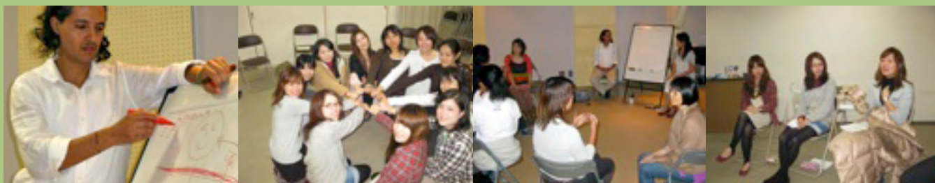
Lors des deux stages à l'Université de Tsuda et au Centre Communautaire de Yokohama

Durant le dernier trimestre 2010 j'ai animé deux stages de Communication Relationnelle Consciente et Bienveillante basée sur le processus de la Communication NonViolente.