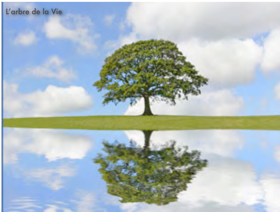
L'arbre de la Vie